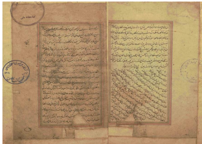
تصویر ۵: تضاد در جهت افق و مورب نوشتار در نسخه خطی نهج البلاغه