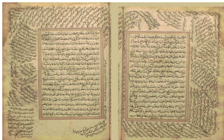
تصویر ۳: پیوستگی بصری در حاشیه نویسی نسخه خطی نهج البلاغه. حاشیه نویسی‌های دسته‌بندی شده نوعی اهمیت بخشی و خلق زیبایی منحصر به فرد را در صفحه نگارش شده به تصویر می‌کشد.

خط شکسته نستعلیق با چیدمان‌های منظم در جهت‌های مختلف نیز بر غالب حاشیه صفحات این نسخه خطی تکرار شده و عامل دیگری بر هماهنگی بصری در این اثر است. جهت خط بسیار مهم است، زیرا وقتی به اثر نگریسته می‌شود، "تا اندازه زیادی چشم را هدایت می‌کند" (استینسون، ۱۱۴، ۱۳۹۰). (تصویر ۳)