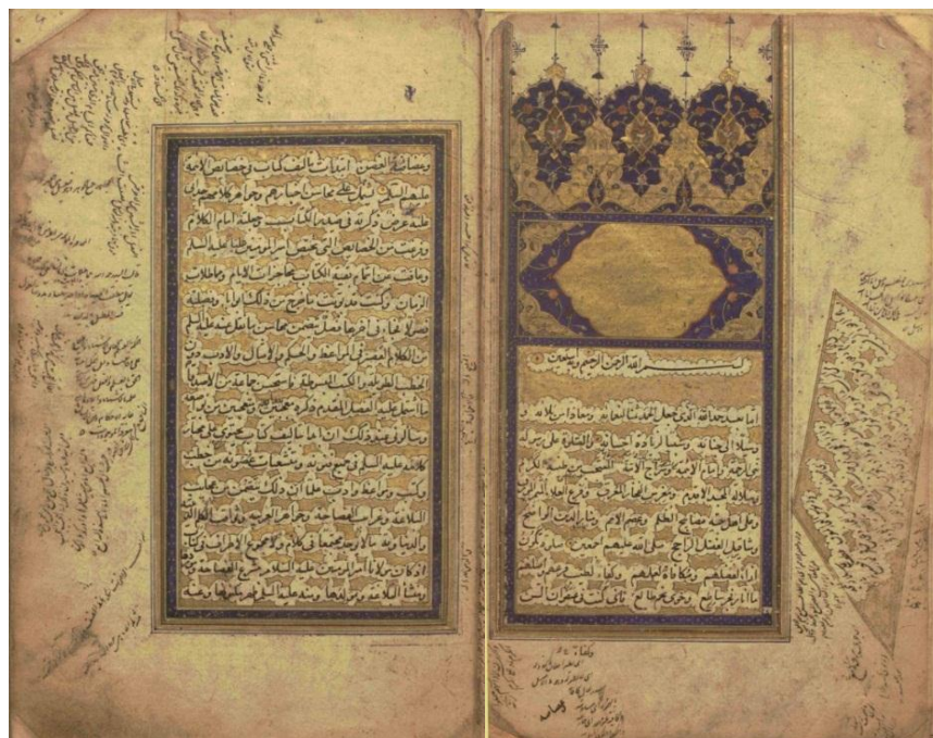
تصویر ۸: صفحه گشایش کتاب نهج البلاغه دوره صفوی، تسلط بصری در بخش‌های تذهیب شده از طریق جذابیت رنگ و تسلط بصری در تغییر جهت نوشتار در حاشیه‌های نسخه خطی نهج البلاغه