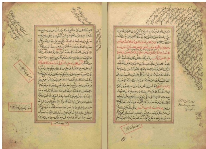
تصویر ۹: حرکت بصری پویا از طریق استفاده از جهت و کادرهای مختلف نوشتار در حاشیه.

جذاب بصری عمل می کند که چشم را از بالا به پایین و از راست به چپ حرکت می دهد. حاشیه نویسی ها توده های نوشتاری متحرک را در اشکال مختلف ایجاد کرده که آرام و روان نوعی سیالیت بصری را به همراه دارد. (تصویر ۹) جهت های متنوع کادرهای حاشیه نویسی ها نیز حرکت بصری ایجاد کرده اند. این عناصر، نوشتار نسخه خطی را از حالت سکون خارج کرده و حسی از سماع قلم را به اثر بخشیده است. بداهه سازی و اتفاق یکی از مزیت های آثار اجرا شده به شیوه دستی است. حاشیه نویسی اثر خطی نهج البلاغه نوعی نظم در بی نظمی را نشان می دهد. بداهه سازی، نشان دهنده خلاقیت ناب هنرمند است که هنگام آفرینش اثر، تمام قوای درونی خود را منسجم و در لحظه ای مناسب به آن هویتی تجسمی می بخشد. (فدوی، ۱۳۹۴)