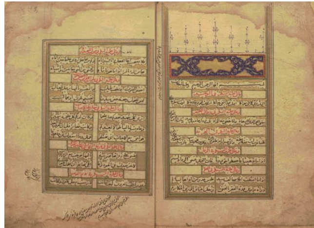
تصویر ۱: صفحه افتتاحیه نهج البلاغه دوره صفوی، همراه با تذهیب هماهنگ با نوشتار بدنه اصلی.