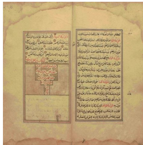
تصویر ۷ ب: تعادل متقارن نوشتار در نسخه خطی نهج البلاغه دوره صفوی .