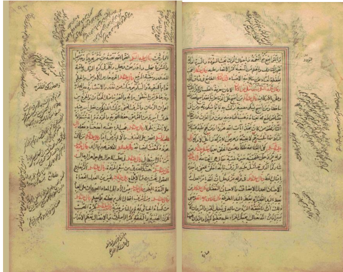
تصویر ۶: تعادل پویای بصری، مدیریت خلاقانه حاشیه نویسی در کنار متن اصلی نهج البلاغه ایجاد حس مطلوب بصری نموده است. هم وزنی فضای پر و خالی مولفه مهم مدیریت نوشتار در صفحه است.

Figure 6: Dynamic visual balance, creative management of annotations along with the main text of Nahjul Balagha has created a desirable visual sense. The balance of full and empty space is an important component of text management on the page.