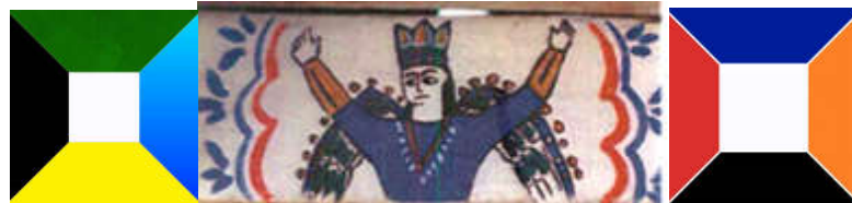
تصویر ۵. فرشته باران، سقف نگاره فولادکلا، رنگ‌ها بازسازی شده در سال ۱۳۷۸، مأخذ: جعفر نژاد، ۱۳۸۰: ۴۱.