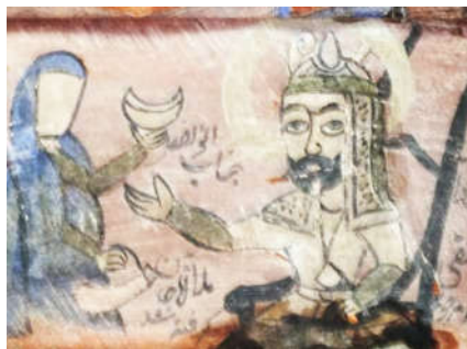
تصویر ۸. جناب ابوالفضل، سقف نگاره تکیه کبریاکلا، بابل، مأخذ: نگارندگان.