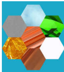
تصویر ۷. هفت آسمان در کلام امیرالمؤمنین

۱۳۹۶: ۶۷). روشنی را ضد تاریکی، وضوح را ضد ابهام، خشکی را ضد تری، گرمی را ضد سردی قرارداد (خطبه ۵۶، بخش ۳: ۴۳۳). شب و روز مظهر سیاهی و سفیدی است که در زندگی انسان و در طبیعت دو قطب مهم و اساسی محسوب می‌شوند. این دو قطب متضاد با ترکیب شدن، رنگ خاکستری به وجود می‌آید که خاکستری از ترکیب سبز و قرمز نیز به وجود می‌آید؛ این رنگی خنثی است که از پختگی رنگ‌ها می‌کاهد (ایتن، ۱۳۸۶: ۱۰۶). رنگ سیاه به‌عنوان رنگی برای این جهانی بودن و نشانگر نفس است. با فقر نیز مترادف است سیاه کردن روی گنهگاران نوعی تنبیه برای آنان است. رنگ نگون‌بختی و نماد شیطان؛ و تداعی بخش گناهکاران در رستاخیز است. سفید نمادی از روز رستاخیز است (همان، ۵۴). رنگ زرد روشن‌ترین و رنگ بنفش تاریک‌ترین رنگ دایره رنگی هستند این دورنگ عجیب‌ترین تضاد سیاهی و سفیدی را دارند و دورنگ مکمل هستند. قرمز و نارنجی در مقابل آبی و سبز دو قطب متقابل سرد و گرم را تشکیل می‌دهند؛ و تضاد شدیدی را ایجاد می‌کنند. سبز و آبی در کنار هم سردترین رنگ‌ها هستند (همان، ۱۲۶).