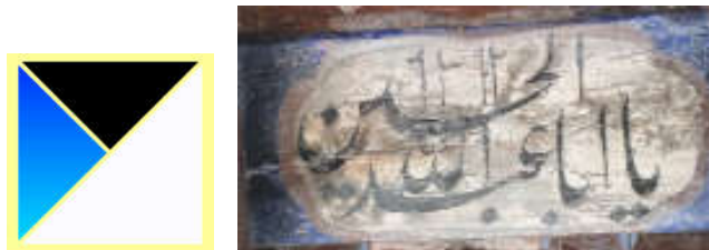
تصویر ۶. یا ابا عبدالله الحسین، نوشتار عاشورایی بر سقف نگاره تکیه کبریاکلا، بابل.

تیره (رنگ شب)، ساختار آرامش و سکوت کامل دارد، رنگی مقدس است که در بین مردم نیز محترم شمرده می‌شود. گنبدها و مناره‌های آبی مانند پلی بین زمین آسمان است (پهلوان، ۱۳۸۷: ۱۲۳). ج - «و جعلنا الیل لباساً» شب را پوششی قراردادیم، برای آرامش شما (اعراف، ۲۶). در (تصویر ۶) ترکیبی از رنگ آبی و زمینه سفید و ترسیم خطوط با رنگ سیاه، آرامش انسان با دیدن نام ائمه با ساختار رنگ و در سقف بودن نقش متناسب است.