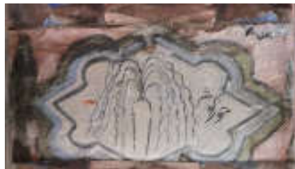
تصویر ۴. حوض کوثر، سقف نگاره کبریا کلا، بخش بابل‌کنار، بابل.