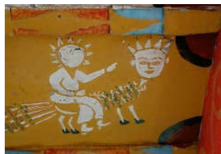
تصویر ۱. پیامبر سوار بر براق، شرحی از معراج، سقف نگاره سقافار آهنگرکلا، قائم‌شهر

ارزیابی رنگ و زیبایی‌شناسی در سه نکته خلاصه می‌شود: حسی و عینی، بیانی، ساختمانی. در بررسی هنر رنگ باید دانست که سمبولیسم بدون دقت بصری و نیروی عاطفی تنها فرمالیسم محض است. اثری بصری بدون حقیقت سمبولیک و قدرت عاطفی تقلیدی مبتذل از طبیعت است (همان، ۵۹). در (تصویر ۱) پیامبر (ص) سوار بر براق تمثیلی از معراج پیامبر است که از دو رنگ سفید، سبز و زرد در بازسازی این اثر استفاده شده است.