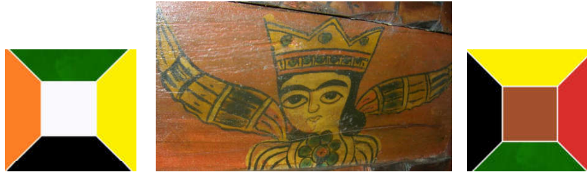
تصویر ۳. فرشته در سقف نگاره کیجا تکیه، بابل، مأخذ نگارندگان.

سبز: آیاتی که قرآن به رنگ سبز اشاره می‌کند: الف - سبزرنگ بهشتی است «ثِيَابًا خَضْرَاءَ» (کهف: ۳۱). ب - باران زمین و طبیعت مرده را سبز و خرم می‌کند (حج: ۶۳)، ج - تهیه آتش از درخت سبز (یس: ۸۰) د - سَبَّعَ سُبُلَاتِ خُضْرٍ هَفْتِ خَوْشِه سبِز (یوسف: ۴۳)، ر - دو بهشت خرم و سرسبز، سبز پررنگ که نشانه‌ی نهایت شادابی و طراوت گیاهان و درختان است و نهایت خرمی برای بهشت است (مکارم شیرازی، تفسیر نمونه، الرحمن: ۳، جلد ۲۳). س - رنگ لباس پذیرایی کنندگان از بهشتیان، سبز «خضر» است (قرآنی، تفسیر نور، انسان: ۲۲، جز ۲۹).