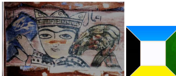
تصویر ۲، سقف نگاره فرشته و نشان دادن نامی اعمال گناه انسان، سقافارکبریا کلا، بخش بابل‌کنار، شهرستان بابل

زرد: آیاتی که قرآن به رنگ زرد اشاره می‌کند: الف - «بَقَرَةٌ صَفْرَاءُ فَاقِعٌ لَوْنُهَا ...» ماده‌گاو زرد یکدست که رنگ آن بینندگان را شاد و مسرور می‌سازد (بقره: ۶۹) رنگ زرد مورد سفارش دین است، علت انتخاب این رنگ به خاطر خوش‌رنگی و درخشندگی آن است که آن‌چنان زیباست که بیننده را به اعجاب وامی‌دارد (مکارم شیرازی، تفسیر نمونه، بقره: ۶۹، جلد اول). ب - «جِمَالَتٌ صُفْرٌ» صفر جمع اصفر به معنای زردرنگ است (مرسلات: ۳۳). رنگ زرد به‌عنوان رنگ اولیه در نقاشی هم برای موضوعات معنوی و آسمانی به کار می‌رود؛ هم برای نقاشی‌هایی که سوژه طبیعت بی‌جان و مادی دارند (ایتن، ۱۳۸۶: ۹۶). زرد از لحاظ نمادی شباهت به گرمای نور آفتاب دارد، یادآور شروعی دوباره است. از لحاظ روانشناسی باعث ارتقا نشاط در انسان است. زرد اولین رنگی است که از تاریکی خارج می‌شود و آبی اولین رنگی است که به تاریکی وارد می‌شود. به‌راحتی در کنار دیگر رنگ‌ها هماهنگی دارد. رنگ قهوه‌ای در کنار زرد ترکیبی زیبا می‌دهد و بنفش سیر رنگ مکمل زرد است (همان، ۶۸). در (تصویر ۲) کارنامه‌ی اعمال گناهکار در دست فرشته به رنگ آبی است که می‌تواند رنگی مناسب برای عمل گناهکار باشد، با توجه به خاصیت رنگ آبی که اولین رنگی است که به تاریکی وارد می‌شود. بسیاری از معماران ترجیح می‌دهند رنگ زرد با سیاه و قرمز را ترکیب کنند (محدثی، ۱۳۶۵: ۶۸). در (تصویر ۳) به نظر می‌رسد انتخاب رنگ زرد برای فرشته مناسب است اما می‌توان از رنگ سفید نیز در این ترکیب استفاده کرد یا اگر زمینه‌ی اثر رنگ سفید باشد بهتر است؛ که در اینجا رنگ قهوه‌ای است. البته ترکیب زرد و قهوه‌ای نیز زیباست. رنگ سیاه در این ترکیب برای ترسیم خطوط، ابرو، چشم و زلف‌ها مورد استفاده قرار گرفته است.