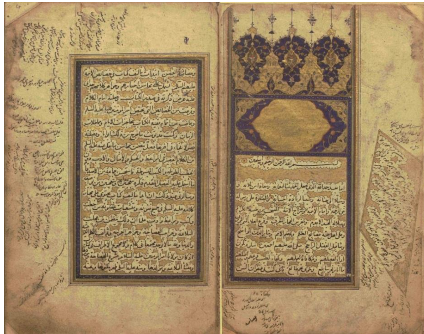
تصویر ۸: صفحه گشایش کتاب نهج البلاغه دوره صفوی، تسلط بصری در بخش‌های تذهیب شده از طریق جذابیت رنگ و تسلط بصری در تغییر جهت نوشتار در حاشیه‌های نسخه خطی نهج البلاغه