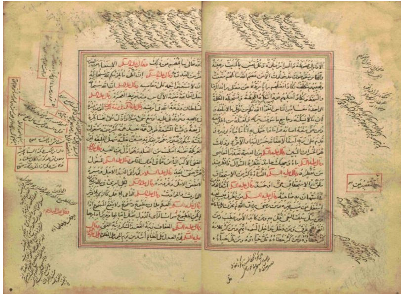
تصویر ۴: تباین در رنگ، قاب بندی نوشتار، تباین در جهت نوشتار و نوع خط مشخصه‌های بصری متمایز صفحات نسخه خطی نهج البلاغه دوره صفوی