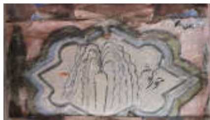
تصویر ۴. حوض کوثر، سقف نگاره کبریا کلا، بخش بابل‌کنار، بابل.