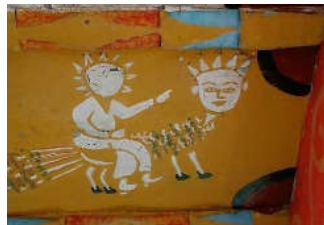
تصویر ۱. پیامبر سوار بر براق، شرحی از معراج، سقف نگاره سقافار آهنگرکلا، قائم‌شهر، مأخذ: نگارندگان

ارزیابی رنگ و زیبایی‌شناسی در سه نکته خلاصه می‌شود: حسی و عینی، بیانی، ساختمانی. در بررسی هنر رنگ باید دانست که سمبولیسم بدون دقت بصری و نیروی عاطفی تنها فرمالیسم محض است. اثری بصری بدون حقیقت سمبولیک و قدرت عاطفی تقلیدی مبتذل از طبیعت است (همان، ۵۹). در (تصویر ۱) پیامبر (ص) سوار بر براق تمثیلی از معراج پیامبر است که از دو رنگ سفید، سبز و زرد در بازسازی این اثر استفاده شده است.