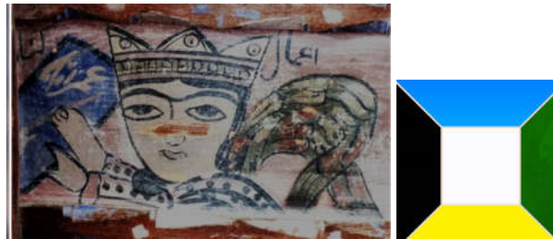
تصویر ۲، سقف نگاره فرشته و نشان دادن نامی اعمال گناه انسان، سقافارکبریا کلا، بخش بابل‌کنار، شهرستان بابل

زرد: آیاتی که قرآن به رنگ زرد اشاره می‌کند: الف - «بَقَرَةٌ صَفْرَاءُ فَاقِعٌ لَوْنُهَا ...» ماده‌گاو زرد یکدست که رنگ آن بینندگان را شاد و مسرور می‌سازد (بقره: ۶۹) رنگ زرد مورد سفارش دین است، علت انتخاب این رنگ به خاطر خوش‌رنگی و درخشندگی آن است که آن‌چنان زیباست که بیننده را به اعجاب وامی‌دارد (مکارم شیرازی، تفسیر نمونه، بقره: ۶۹، جلد اول). ب - «جِمَالَتٌ صُفْرٌ» صفر جمع اصفر به معنای زردرنگ است (مرسلات: ۳۳). رنگ زرد به‌عنوان رنگ اولیه در نقاشی هم برای موضوعات معنوی و آسمانی به کار می‌رود؛ هم برای نقاشی‌هایی که سوژه طبیعت بی‌جان و مادی دارند (ایتن، ۱۳۸۶: ۹۶). زرد از لحاظ نمادی شباهت به گرمای نور آفتاب دارد، یادآور شروعی دوباره است. از لحاظ روانشناسی باعث ارتقا نشاط در انسان است. زرد اولین رنگی است که از تاریکی خارج می‌شود و آبی اولین رنگی است که به تاریکی وارد می‌شود. به‌راحتی در کنار دیگر رنگ‌ها هماهنگی دارد. رنگ قهوه‌ای در کنار زرد ترکیبی زیبا می‌دهد و بنفش سیر رنگ مکمل زرد است (همان، ۶۸). در (تصویر ۲) کارنامه‌ی اعمال گناهکار در دست فرشته به رنگ آبی است که می‌تواند رنگی مناسب برای عمل گناهکار باشد، با توجه به خاصیت رنگ آبی که اولین رنگی است که به تاریکی وارد می‌شود. بسیاری از معماران ترجیح می‌دهند رنگ زرد با سیاه و قرمز را ترکیب کنند (محدثی، ۱۳۶۵: ۶۸). در (تصویر ۳) به نظر می‌رسد انتخاب رنگ زرد برای فرشته مناسب است اما می‌توان از رنگ سفید نیز در این ترکیب استفاده کرد یا اگر زمینه‌ی اثر رنگ سفید باشد بهتر است؛ که در اینجا رنگ قهوه‌ای است. البته ترکیب زرد و قهوه‌ای نیز زیباست. رنگ سیاه در این ترکیب برای ترسیم خطوط، ابرو، چشم و زلف‌ها مورد استفاده قرار گرفته است.