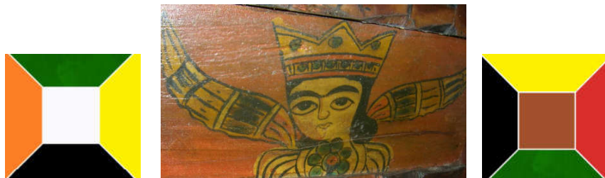
تصویر ۳. فرشته در سقف نگاره کیجا تکیه، بابل، مأخذ نگارندگان.

سبز: آیاتی که قرآن به رنگ سبز اشاره می‌کند: الف - سبزرنگ بهشتی است «ثِيَابًا خَضْرَاءَ» (کهف: ۳۱). ب - باران زمین و طبیعت مرده را سبز و خرم می‌کند (حج: ۶۳)، ج - تهیه آتش از درخت سبز (یس: ۸۰) د - سَبَّعَ سُبُلَاتِ خُضْرٍ هَفْتِ خَوْشِه سبِز (یوسف: ۴۳)، ر - دو بهشت خرم و سرسبز، سبز پررنگ که نشانه‌ی نهایت شادابی و طراوت گیاهان و درختان است و نهایت خرمی برای بهشت است (مکارم شیرازی، تفسیر نمونه، الرحمن: ۳، جلد ۲۳). س - رنگ لباس پذیرایی کنندگان از بهشتیان، سبز «خضر» است (قرآنی، تفسیر نور، انسان: ۲۲، جز ۲۹).